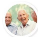
TYPE 2 DIABETES

JA-CHRODIS adoptó la siguiente definición de «buena práctica»: